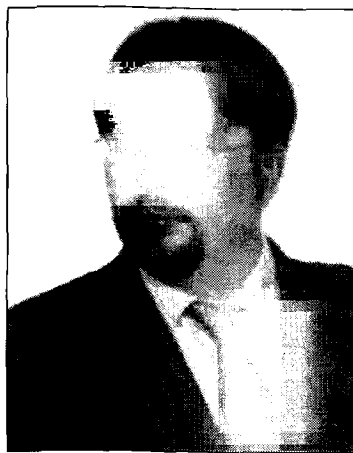
Byle tylko nie być pracownikiem AIG

Środa przyniosła znikomą ilość doniesień z rynku ubezpieczeń. Bez wątpienia na uwagę zasługiwała wiadomość o zwrocie przyznanych premii przez większość obdarowanych nimi menedżerów AIG. W związku z tym nasuwają się dwa wnioski. Pierwszy - optymistyczny - jest taki, że siła nacisku publicznego wciąż jest potężną bronią klientów. Na marginesie: warto, aby pamiętały o tym polskie banki przy kontrowersyjnych kwestiach opcji walutowych i kredytów hipotecznych. Ubezpieczycielom (na szczęście) nie trzeba tego przypominać, czego dowodem są choćby obecne starania o jak najdogodniejszą dla klienta likwidację szkód. Drugi wniosek jest jednak smutny. Wciąż nie wiadomo, czy ci, którzy otrzymali premie, byli winni kłopotów firmy czy też nie. Nacisk w sprawie AIG przyczynił się jednak do tego, że, jak twierdzą amerykańskie media, przyznanie się obecnie do pracy w tej firmie budzi odrazę otoczenia.